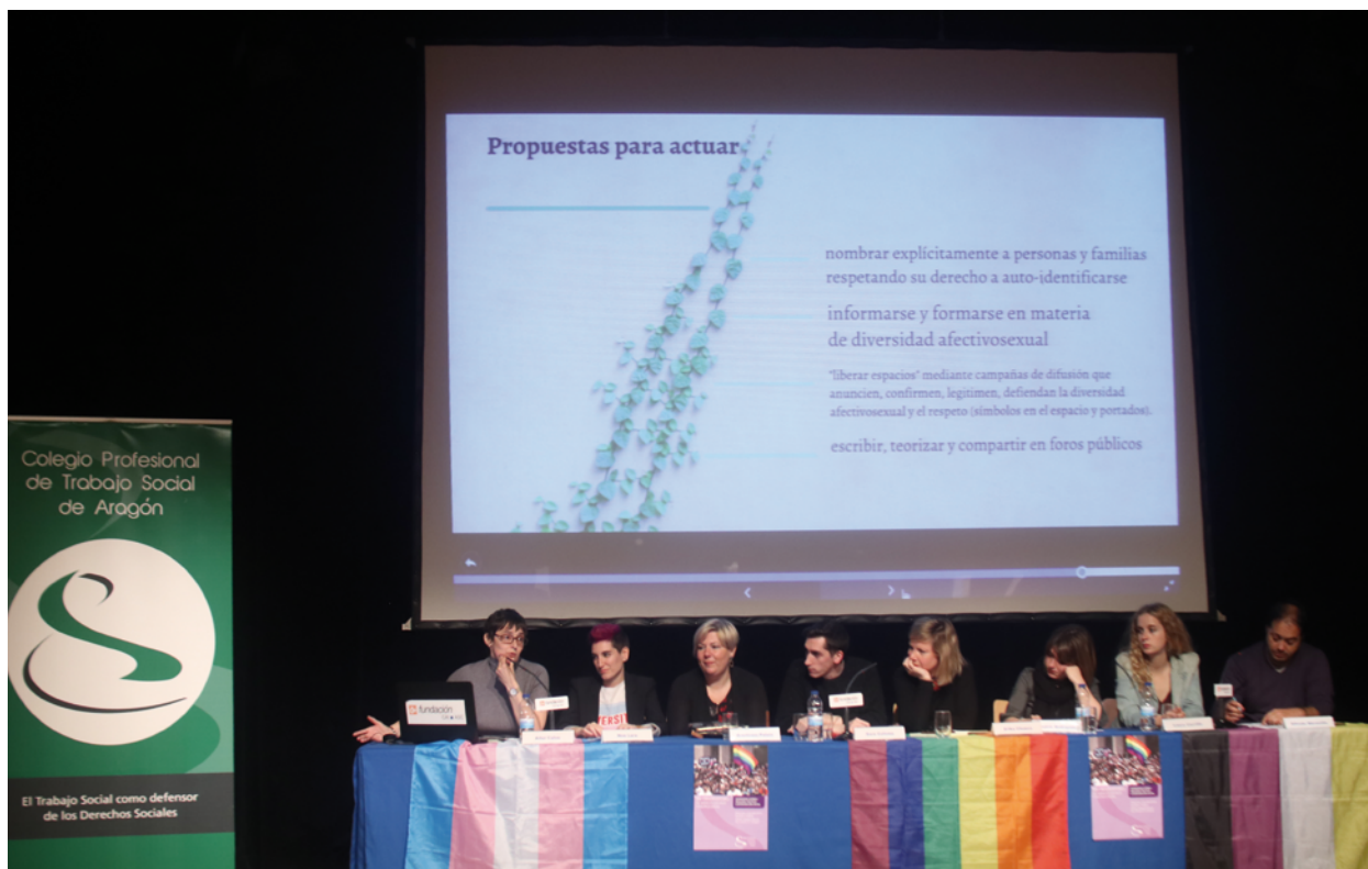
Mesa: El papel del Trabajo Social con el colectivo LGTBIQ+

trabajar desde la prevención: hábitos y entornos saludables, siendo fundamental el conocimiento del entorno y contexto.