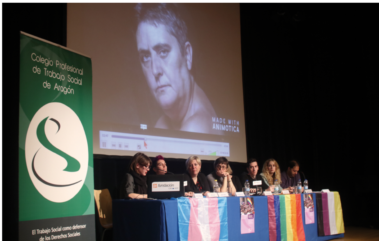
Mesa: El papel del Trabajo Social con el colectivo LGTBQ+