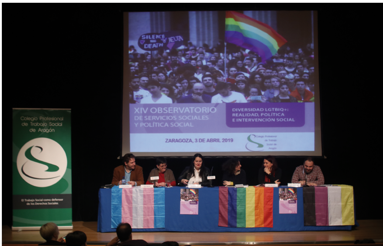
Panel: Políticas sociales para personas LGTBIQ+ en Aragón

donde se mostraron ejemplos claros de dificultades en el desarrollo de su vida cotidiana, a la hora de realizar trámites administrativos o de mayor importancia, como a la hora de realizar una adopción o de solicitar la reproducción asistida.