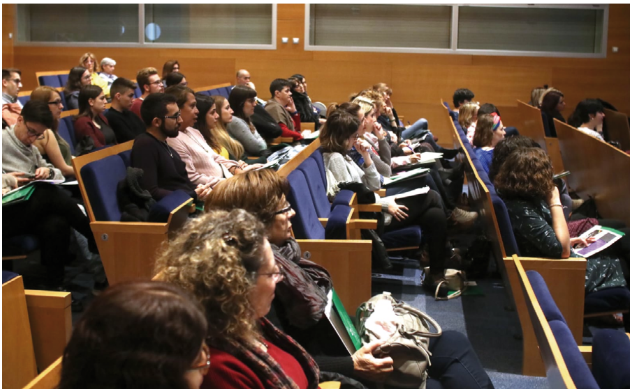
Intervención del público