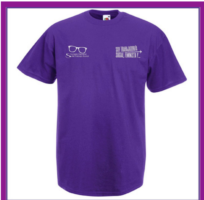
Camiseta "Soy trabajadora social y feminista"